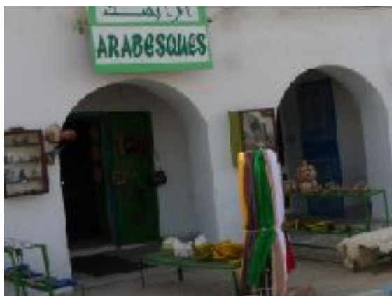
Santons, oeuvres de Sejnane, plats, statues à découvrir